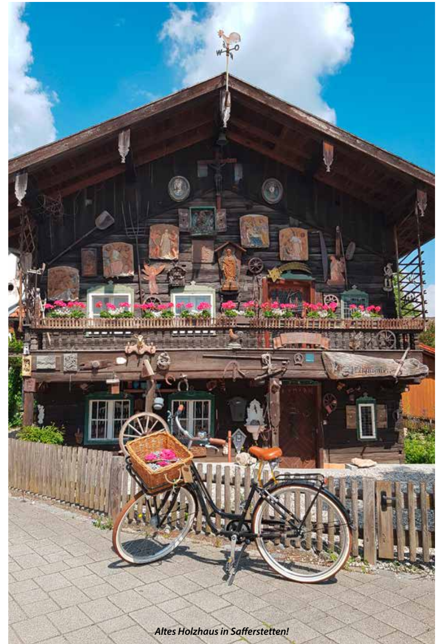
Altes Holzhaus in Safferstetten!